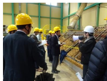
先進地事例視察会