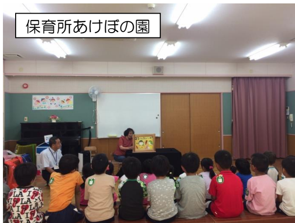
保育所あけぼの園