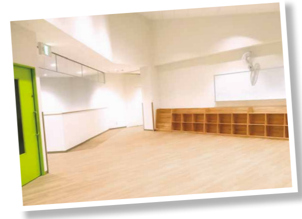
2階絵本コーナー (三重県産材の家具を設置)