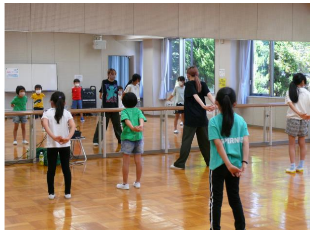
○はじめてのヒップホップダンス