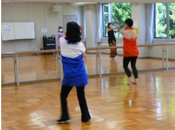
○ボリウッド インド映画の曲で踊ろう！