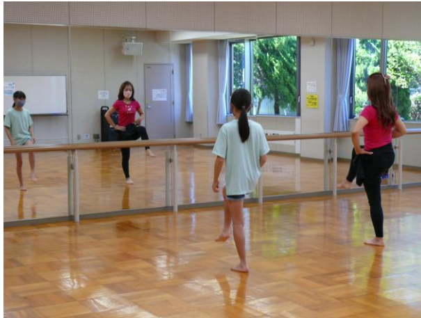
○フラダンスで脳トレ