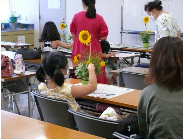
○やさしいいけばな