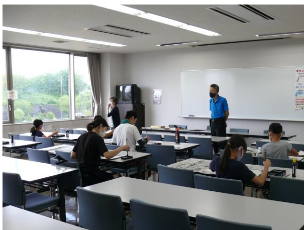
○毛筆で色紙に好きな文字を書こう