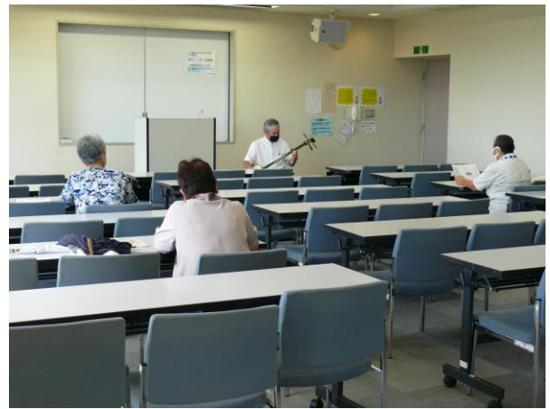
○楽しく唄おう「伊勢音頭」