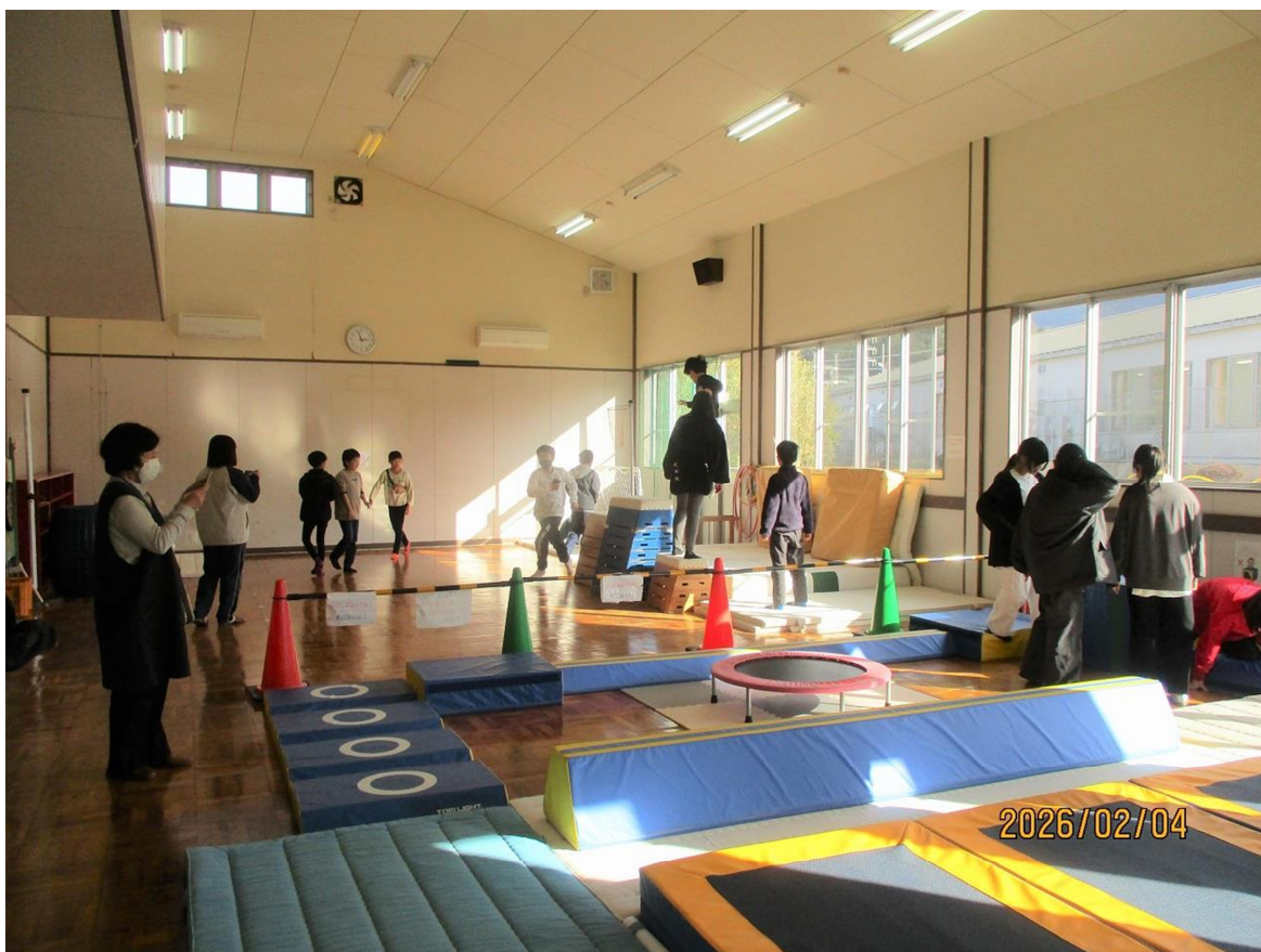
図4：ワークショップ時の館の様子