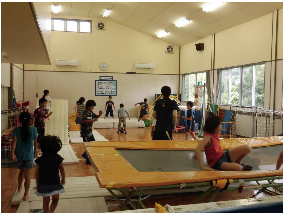
図3：大型遊具撤去前の館の様子