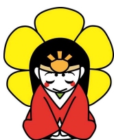
伊勢市の観光PRキャラクター はなてうちやん