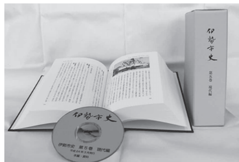
伊勢市史第5巻「現代編」