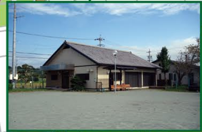
東新村公民館【自治会避難所】