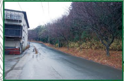
土砂災害危険箇所