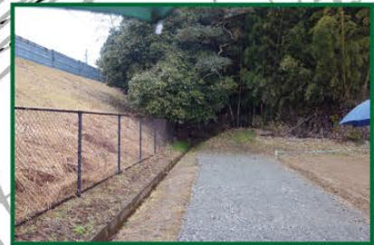
地震時避難経路として利用