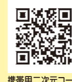
携帯用二次元コード