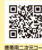
携帯用二次元コード