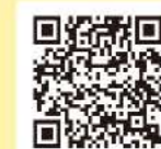
携帯用二次元コード