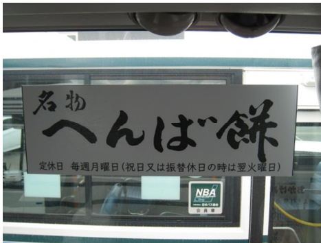
Aタイプ（ステッカー）イメージ