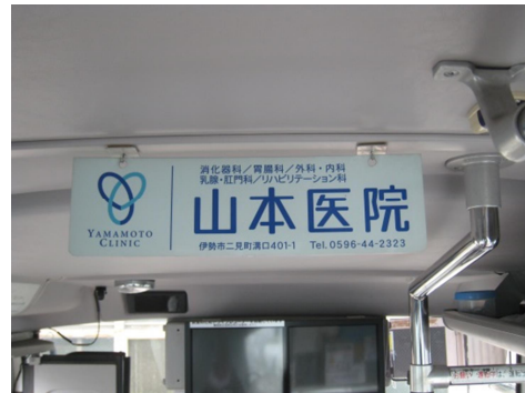
Bタイプ（吊下）イメージ

バス車体ステッカー・バス車内ともデザインは自由にご使用いただけますが、製作の際には素材データを事前にご提供いただく必要があります。