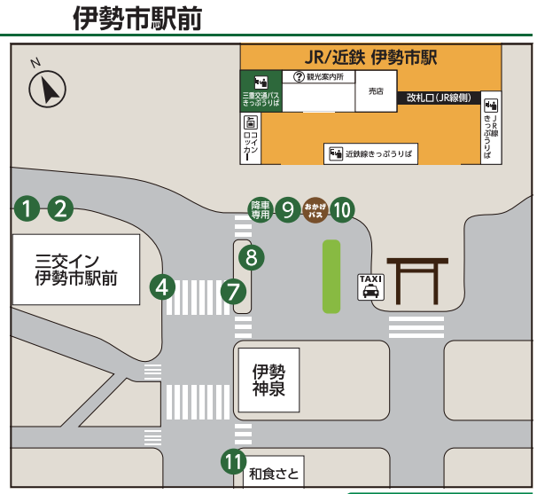
伊勢市駅前きっぷうりばのご案内