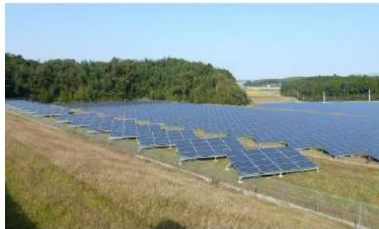
分散配置、芝草植栽により、眺望に配慮