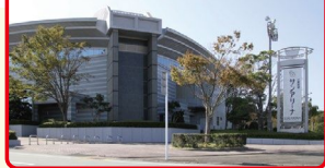
伊勢フットボール ヴィレッジ