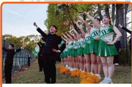
三重大学応援団参戦!