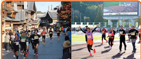
伊勢が誇る観光名所「おはらい町」& 陸上競技場のトラックを走り抜けます!