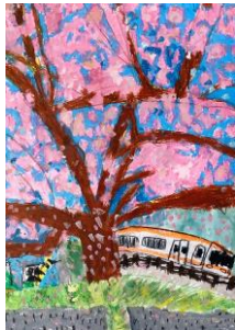
⑬ 宮川駅 (絵)