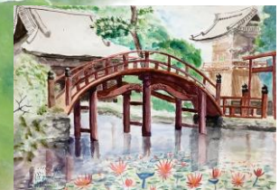
⑦ 金剛證寺 (絵)