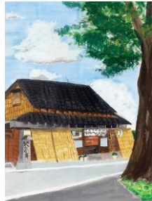
⑭ へんばや本店 (絵)