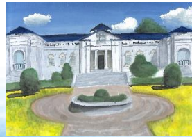
② 徴古館 (絵)