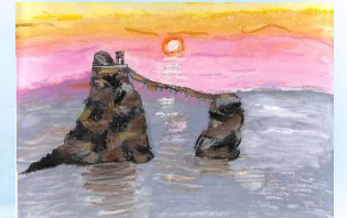
⑤ 夫婦岩 (絵)