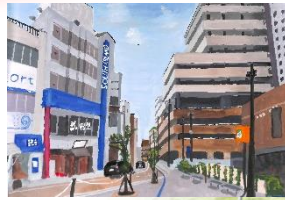
① 伊勢市駅前 (絵)