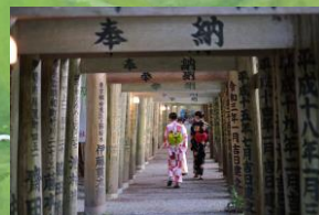
⑩ 豊川菖菰荷神社 (写真)