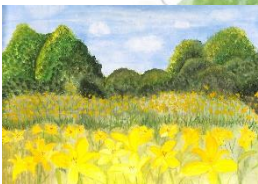
⑫ 上野町赤井山 (絵)