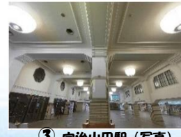
③ 宇治山田駅 (写真)