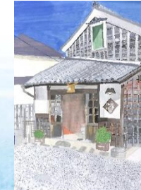
④ 河崎川の駅 (絵)