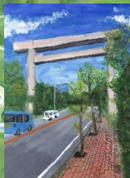
⑪ 御幸道路 (絵)