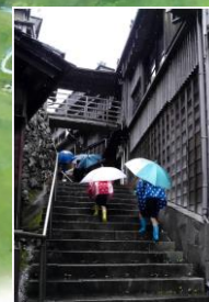
⑨ 古市町麻吉旅館 (写真)