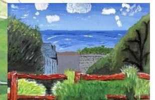
⑥ 音無山 (絵)