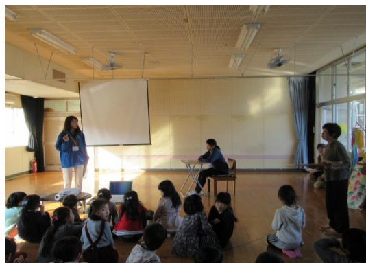
小学生対象キッズサポーター養成講座