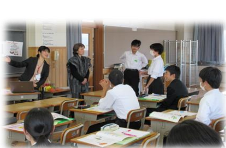
中学生キッズサポーター養成講座