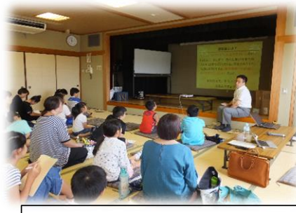
夏休み小学生キッズサポーター