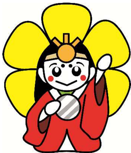
伊勢市の 観光PRキャラクター

豊かな自然に囲まれた私たちのまち・伊勢は、 歴史や文化など魅力がたくさんあふれています。 あなたの感じた伊勢の好きなところ、楽しいことなどを、あ なただけの作品にして世界にアピールしよう！