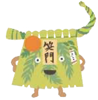
Illustration by tupera tupera

☆季語には次のようなものがあります。(出典：角川書店編「合本 俳句歳時記 第三版」)