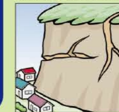
がけにひびわれができる