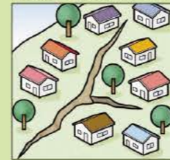
地面にひび割れができる