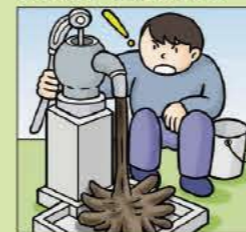
沢や井戸の水が濁る