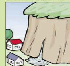
斜面から水がふきだす