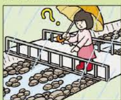
雨が降り続けているのに川の水位が下がる