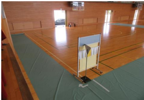
段ボールは倒れないように、これはあまりよくない例です。