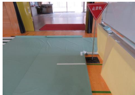
模擬信号・横断歩道・標識等は持参し設置します。