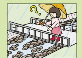
雨が降り続けているのに川の水位が下がる