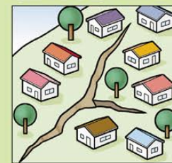
地面にひび割れができる