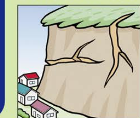
がけにひびわれができる