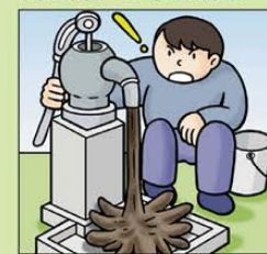
沢や井戸の水が濁る