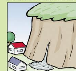
斜面から水がふきだす