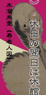
水溜米室 (寿老人圖)