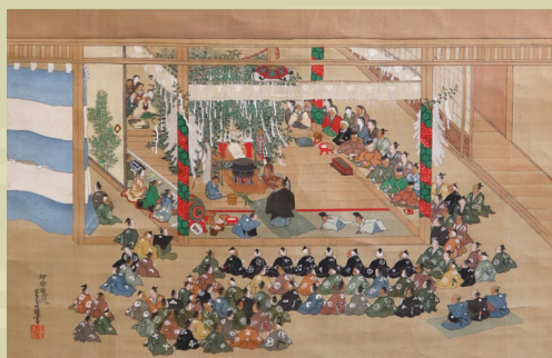
神楽職内人重茂《伊勢大々御神楽図》

本展では、御師たちが描いた絵画資料を展示し、伊勢神宮鳥居前町として独自に育まれた「文化都市」としての一端を紹介します。文化の坩堝（るつぼ）に眠る美しき作品の数々をご堪能いただければ幸いです。