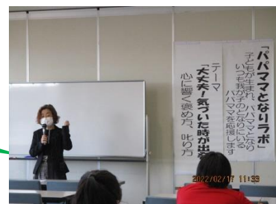
パパママとなりラボの様子

注意：新型コロナウイルス感染症等予防のため、保護者の方は不織布マスクの着用をお願いします。 当日、発熱、せき等の症状がないか体調をご確認の上ご参加ください。 なお、諸般の事情により、延期または中止になる場合があります。ご了承ください。