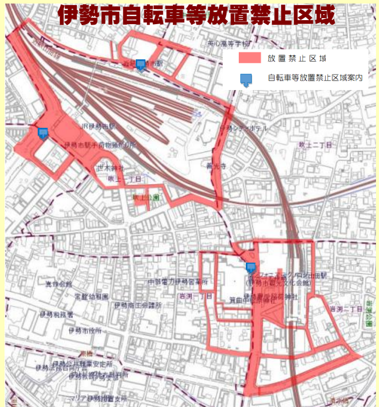
伊勢市自転車等放置禁止区域