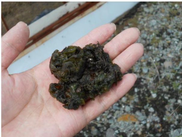
イシクラゲ(藻の一種)