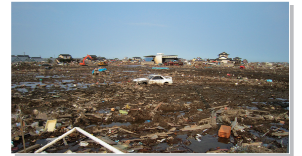
東日本大震災での津波被害 (宮城県名取市)

伊勢市では、これらが発表されたときには、防災行政無線のサイレンと放送で、市民の皆さんにお知らせをしますので、適切な避難行動をとってください。