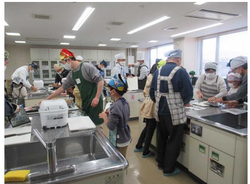
巻き寿司料理教室の様子

「男女共同参画情報」の紙面送付は 今回で終了させていただきます。 今後は、市ホームページをご覧ください。 (右の二次元コードからご覧いただけます)