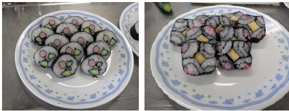
教室で作った巻き寿司(左:お花柄 右:四海巻)

教室では、伊勢湾の海苔についての説明を聞いた後、講師の指導の下、2種類の飾り巻き寿司を作りました。参加者は楽しみながらも熱心に作り、最後は自分たちで作った巻き寿司を、アオサノリを使ったお味噌汁とともに試食しました。