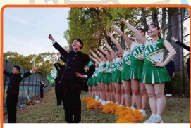
三重大学応援団参戦!

伊勢の食でランナーのみなさまをおもてなし! ハーフマラソン、5キロのゴール後に エイドステーションを設置します!