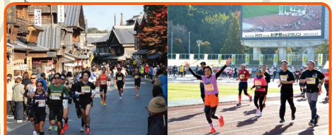
伊勢が誇る観光名所「おはらい町」& 陸上競技場のトラックを走り抜けます!