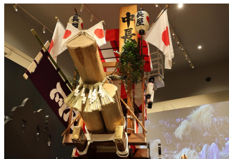
<歴史文化の魅力発信>