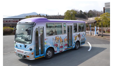
<高齢者・障がい者へのバス券交付>