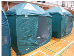
<避難所環境の充実>