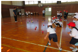
<教育活動への支援>