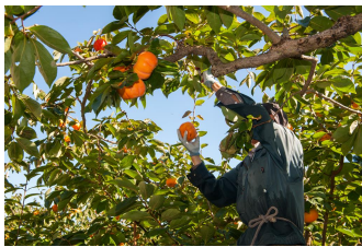
<蓮台寺柿の次世代継承>