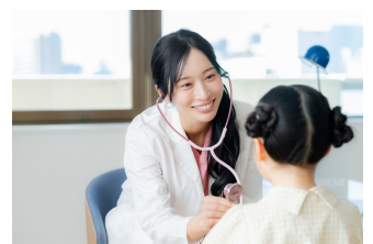
<子ども医療費の助成>