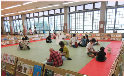
伊勢市 企業版ふるさと納税

「子ども読書支援プロジェクト」は子ども読書の読書支援のため、図書館分野の専門人材を新たに登用し、本来の学校図書館の機能や学校司書の専門性を広く周知し、学校図書館の積極的な活用にもつなげる取組です。公共図書館とも連携し、広く読書支援を展開します。