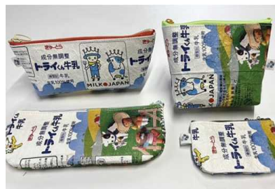
牛乳パックのアップサイクル商品 10,000円