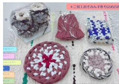
手づくり製品セット 13,000円