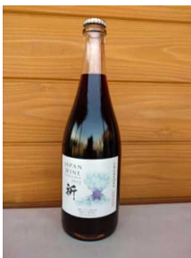
伊勢ワイン(赤スパークリング)祈 750ml1本 14,000円

10,000円以上の寄附をしていただいた方で、市外にお住まいの方には、市内の障害者就労施設で働く方々が心を込めて作った返礼品をお送りします。