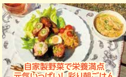
自家製野菜で栄養満点 元気いっぱい! 彩り朝ごはん