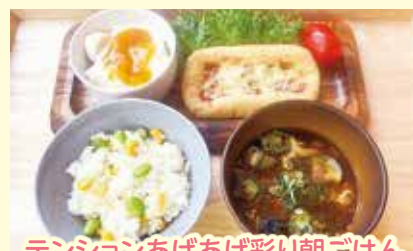
テンションあげあげ彩り朝ごはん