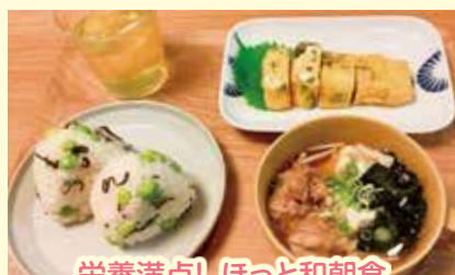
栄養満点! ほっと和朝食