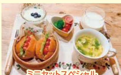
ミニセットスペシャル