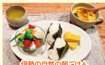
伊勢の自然の朝ごはん