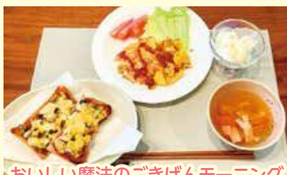
おいしい魔法のごきげんモーニング