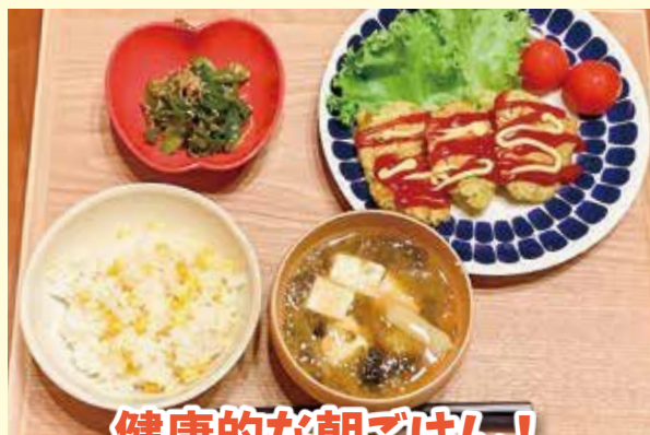
健康的な朝ごはん!