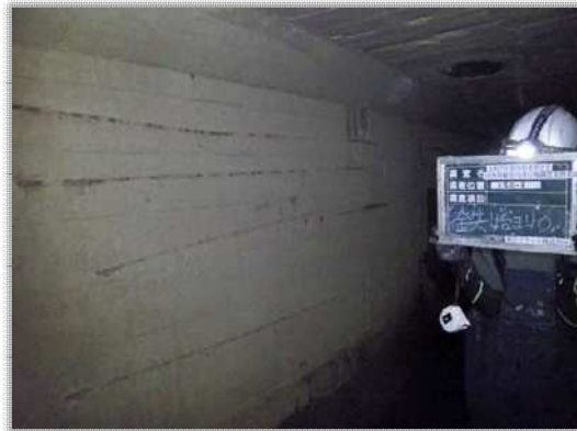
管路の腐食による鉄筋露出