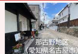
那古野地区 (愛知県名古屋)