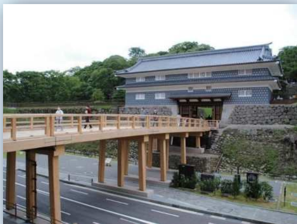
金沢城の復元整備(鼠多門・鼠多門橋) (石川県金沢市)