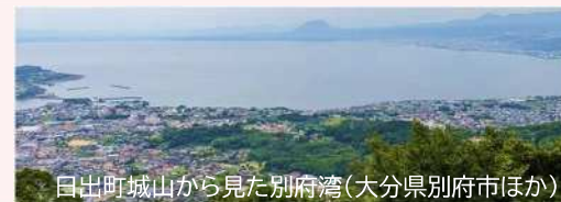
日出町城山から見た別府湾(大分県別府市ほか)