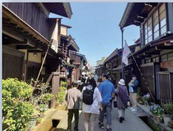
町並みを散策する観光客 (岐阜県高山市)