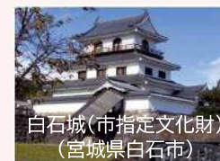
白石城(市指定文化財) (宮城県白石市)