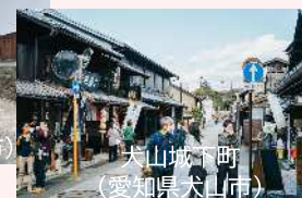
犬山城下町 (愛知県犬山市)