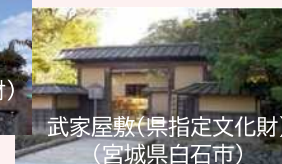
武家屋敷(県指定文化財) (宮城県白石市)