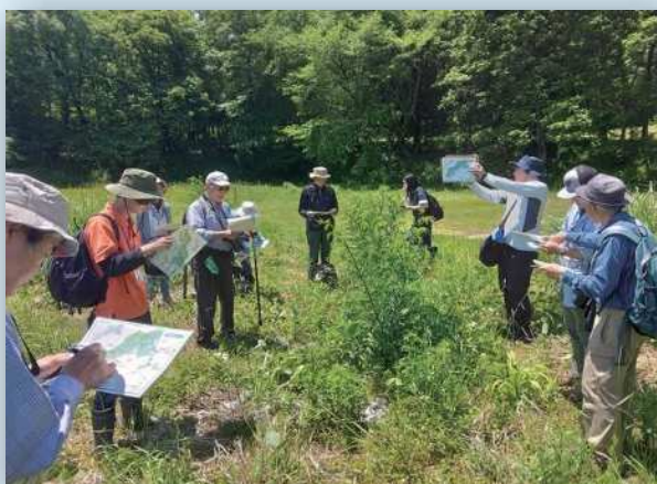
安曇野オオルリシジミ保護対策会議による卵数調査状況 (国営アルプスあづみの公園)