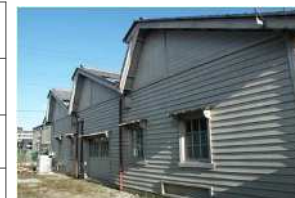
国登録有形文化財の例 旧埼玉県繊維工業試験場 (現・ちちぶ銘仙館)