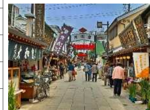
国選定重要文化的景観の例 葛飾柴又の文化的景観

■ 現在、歴まち計画の作成に必須となっている文化財(重点区域の設定に必須) ■■■ 国の価値づけがある文化財や、地域において規制措置が講じられている文化財(無形のものを除く)