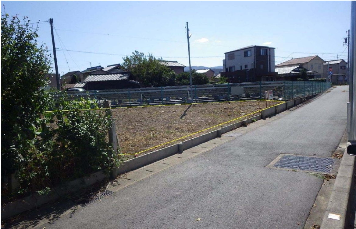
接道状況(北西側から撮影)