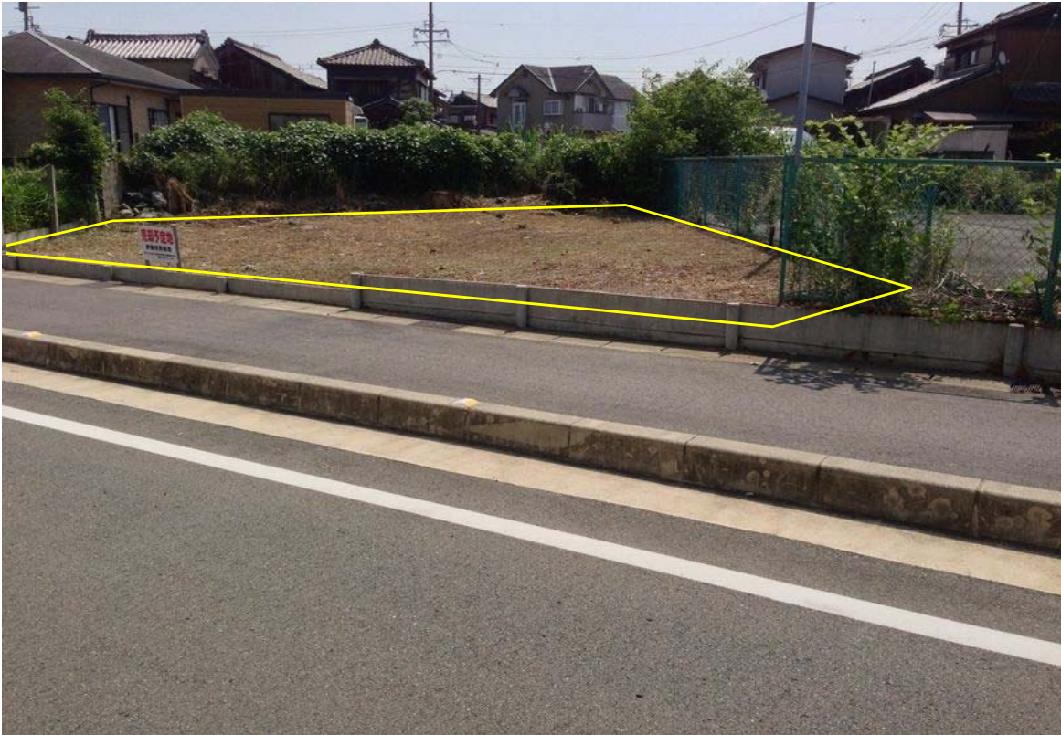
全景(南西側から撮影)